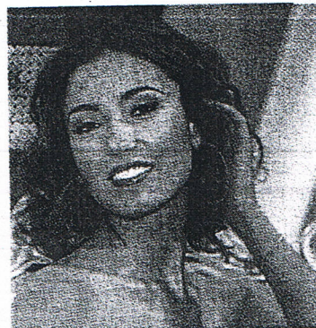
La testimonial La showgirl Caterina Balivo